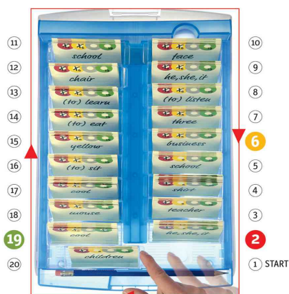
Visuel de référence: Explique le principe "déplacer les cases"