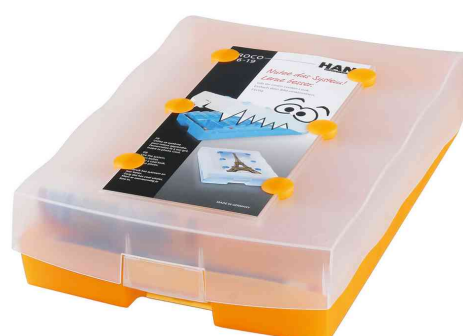
Boîte à fiches CROCO 2-6-19, orange translucide