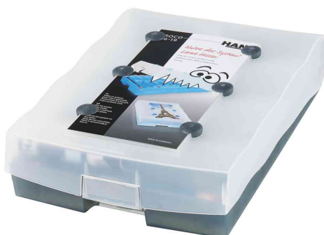
Boîte à fiches CROCO 2-6-19, gris translucide