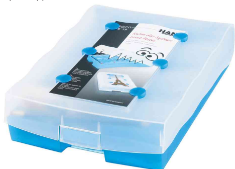
Boîte à fiches CROCO 2-6-19, bleu translucide