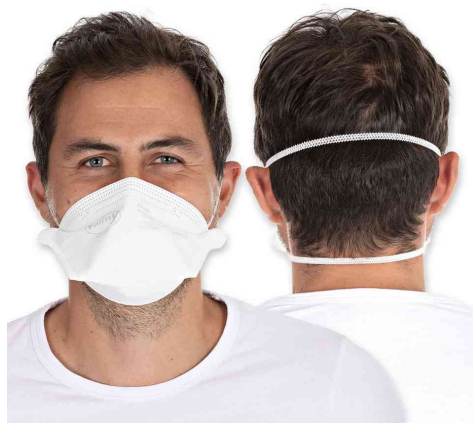
Visuel de référence: montre le produit en utilisation

Ce masque répond aux prescriptions des autorités sanitaires dans le cadre de la lutte contre la Covid-19