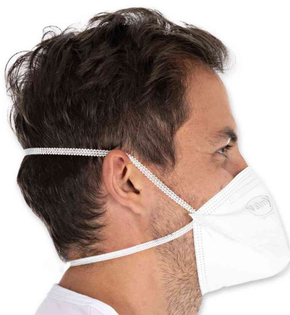
Visuel de référence: présente le produit en utilisation