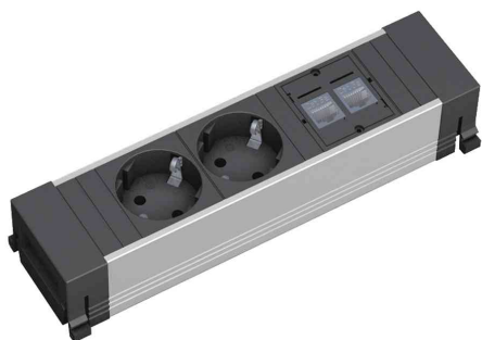
Steckdoseneinheit Power Frame