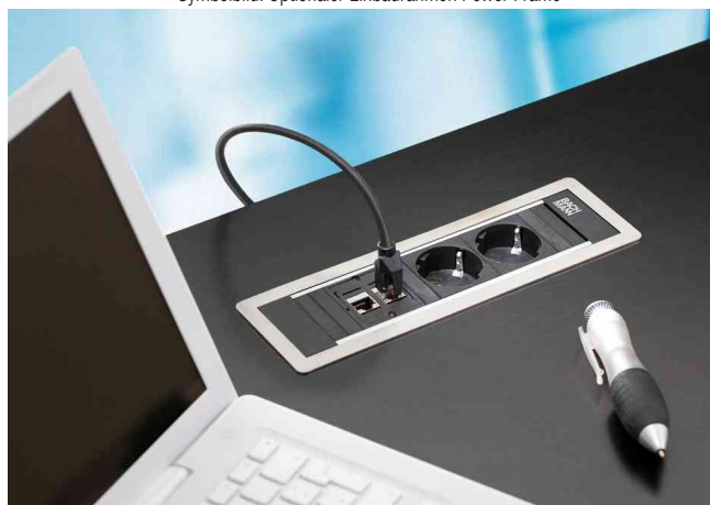
Zeigt das Produkt in der Anwendung