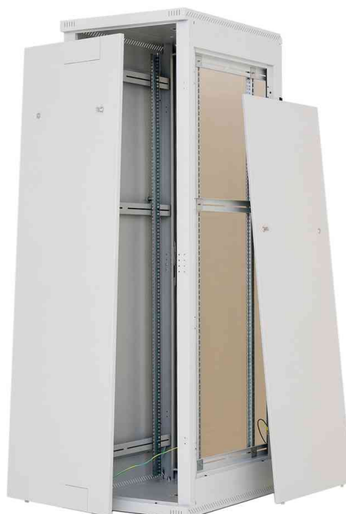
Mit abnehmbarem Seiten- und Rückwände