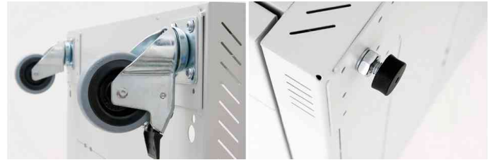
Montagemöglichkeit für Rollen oder Nivellierfüße