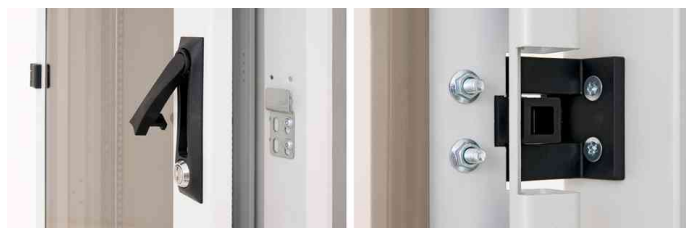
Schwenkebelgriff - flexible Türöffnung