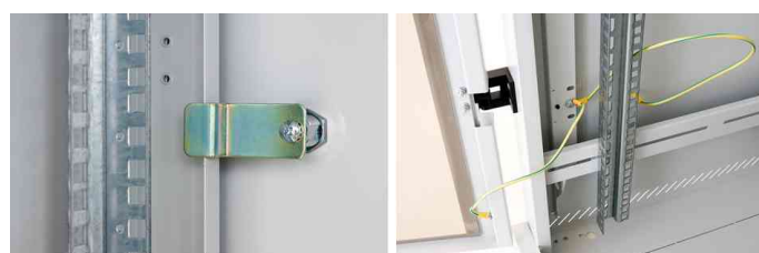
Befestigungsteil und Schlossteil der abnehmbaren Rückwand