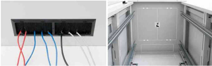
Herausbrechbare Verblendungen - Öffnung für die Belüftungseinheit