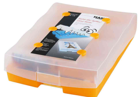
Lernkartei CROCO 2-6-19, orange-transluzent