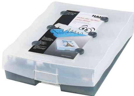
Lernkartei CROCO 2-6-19, grau-transluzent