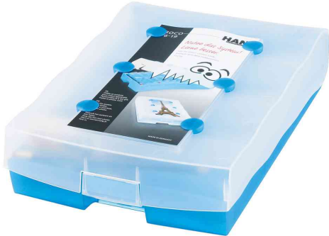
Lernkartei CROCO 2-6-19, blau-transluzent