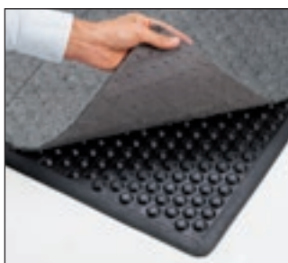
Der Typ ES mit Halbkugel-Design für hohen Anti-Ermüdungseffekt, für normale Beanspruchung - in nassen/ölgigen Bereichen