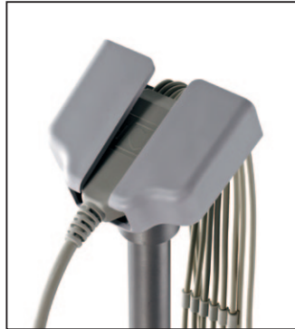
Halterung mit Value-Ableitungskabeln

Die Halterung für Barcodeleser ist sowohl für den neuen als auch alten Barcode-Scanner geeignet.