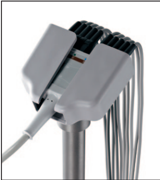
Halterung mit Multilink-Kabeln

Der einfache Arm ist mit Value- und Multilink-Kabeln kompatibel.