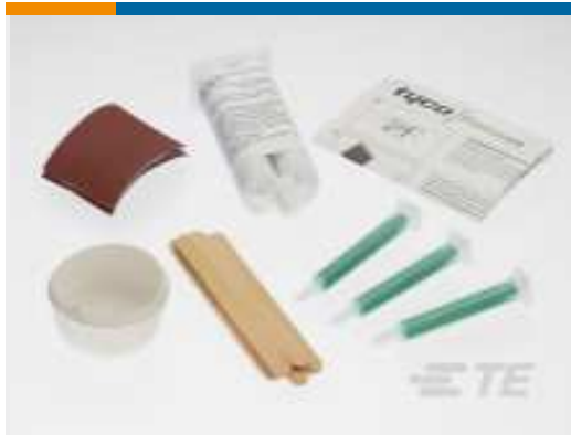
TE Teilenummer 657863-000 S1125-KIT-8