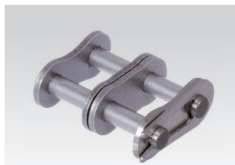
Nr. 11/E: Steckglied mit Federverschluss