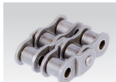
Nr. 15/C: gekröpftes Doppelglied