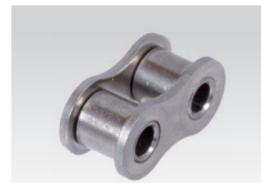
Nr. 4/B: Innenglied (2 Stück erforderlich)