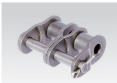
Nr. 12/L: gekröpftes Glied mit Splintverschluss