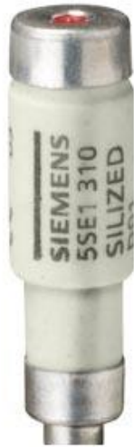
SILIZED-SICHERUNGSEINSATZ 400V GR, HALBLEITERSCHUTZ GR.D01 16A