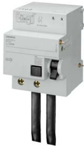
FI-BLOCK F. LS-SCHALTER 5SP4 TYP A PSE/SSF 80/100A 2-POLIG IFN 30MA 230V