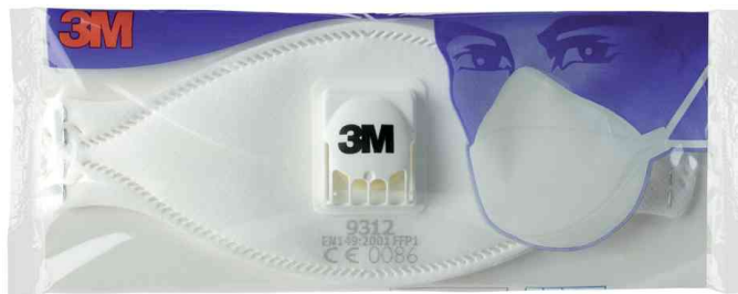
Masque de protection respiratoire 9300, emballage unique