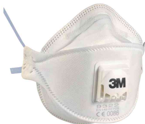
Masque de protection respiratoire serie 9300

Ce masque ne correspond pas aux prescriptions des autorités sanitaires dans le cadre de la lutte contre la Covid-19