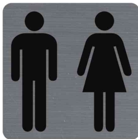
Hinweisschild "Toilettes Dame/Homme"