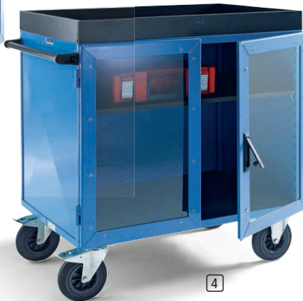
Abb. mit Zubehör