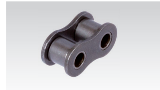
Nr. 4/B: Innenglied (3 Stück erforderlich)

Bestellangaben: z.B.: Artikel-Nr. 131 003 00, Verschluss Nr. 11/E, 06 B-3