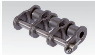
Nr. 12/L: gekröpftes Glied mit Splintverschluss