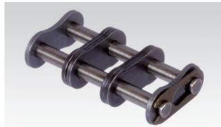
Nr. 11/E: Steckglied mit Federverschluss