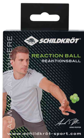
Balle de réaction, emballage