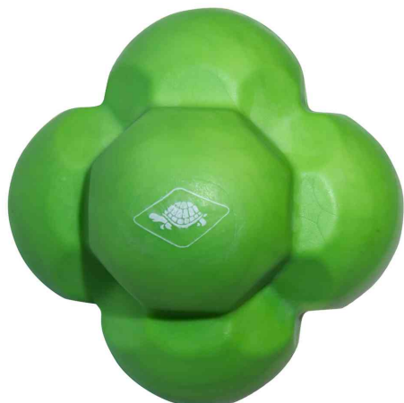
Balle de réaction