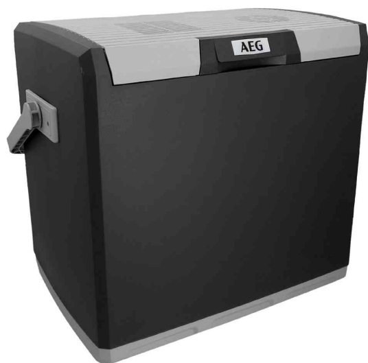
Glacière KK 28