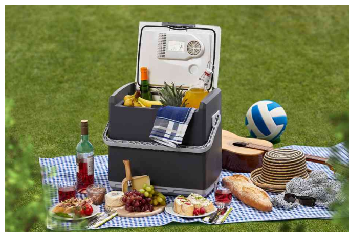
Visuel de référence : présente le produit en utilisation