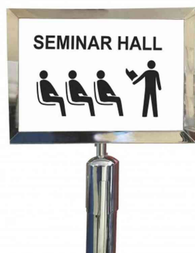
Accessoire: cadre d'information, chrome