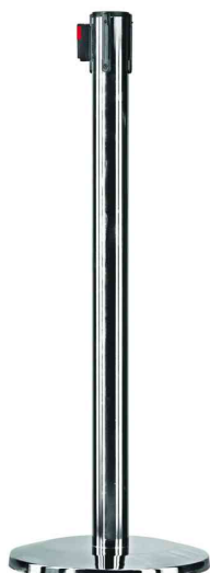
Système d'accueil - kit, chrome