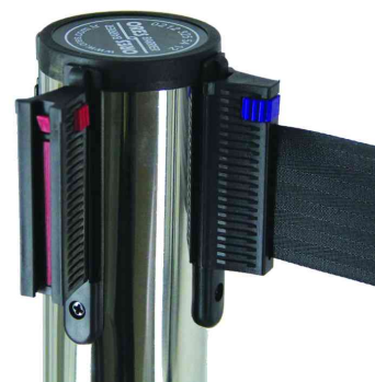
Vue détaillée: tête