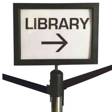
Accessoire: cadre d'information, noir