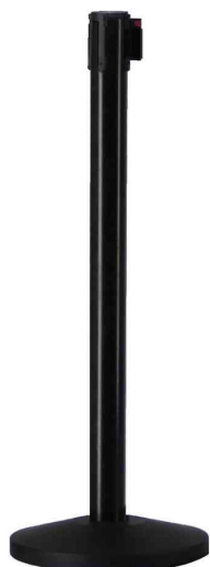
Système d'accueil - kit, noir