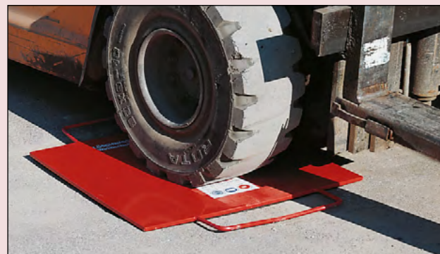
Überfahrbare Kanalabdeckung, Bestell-Nr. 130-305-62