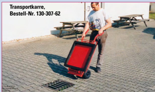
Transportkarre, Bestell-Nr. 130-307-62