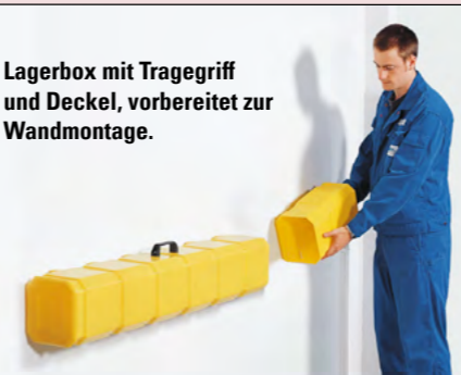
Lagerbox mit Tragegriff und Deckel, vorbereitet zur Wandmontage.