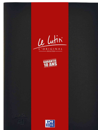
Visuel de référence: Protège-documents "Le Lutin", noir