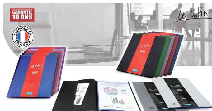
Série "Le Lutin"