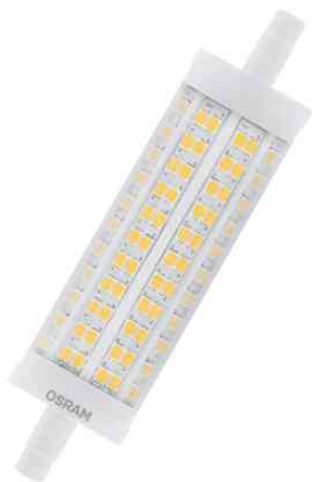
Visuel de référence: Ampoule LED LINE, culot R7s