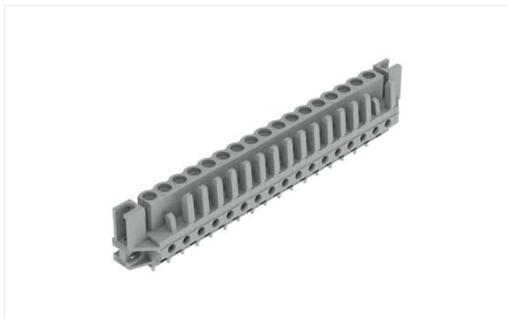
Farbe: ■ grau