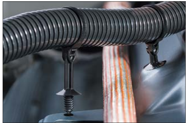
Die T50ROSFT612.5SO Serie eignet sich hervorragend, um unterschiedliche Höhen oder Hindernisse zu überbrücken.