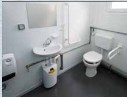
behindertengerechte Ausführung möglich