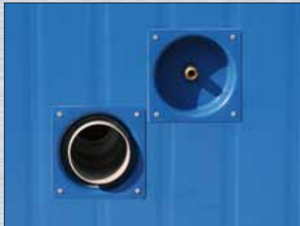
Wasseranschluss, in der Wand versenkt