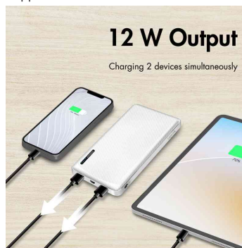
Visuel de référence : montre le produit en utilisation