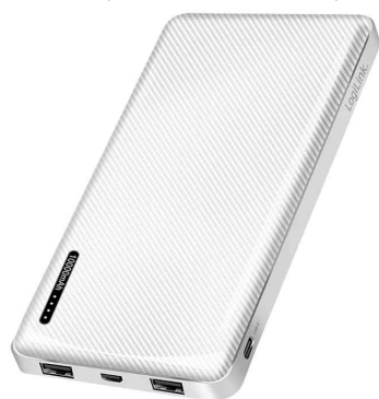
Batterie externe, blanc

- convient pour iPhone, iPad, smartphones Android, appareils GPS, caméras et autres appareils avec connexion USB