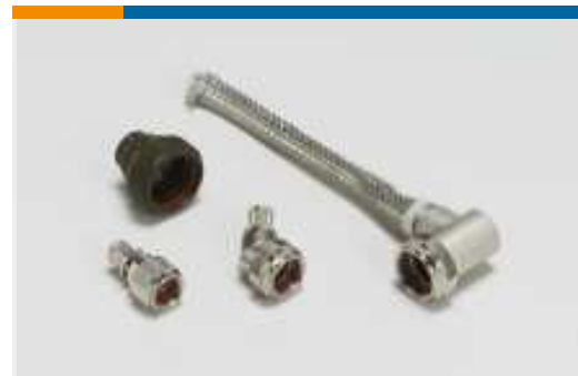
Robuste Endgehäuse und Adapter (2064)