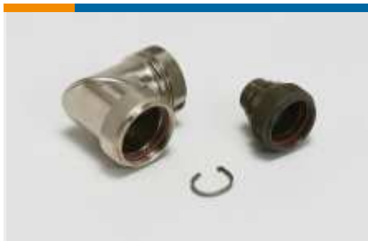
Abgeschirmte Endgehäuse und Adapter(1)