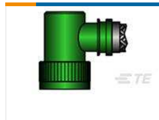
TE Teilnr.:807671-000 204M210-19A05