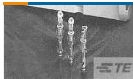
TE Teilenummer 1-1108756-1 HSK.Bu.C.1,5 qmm