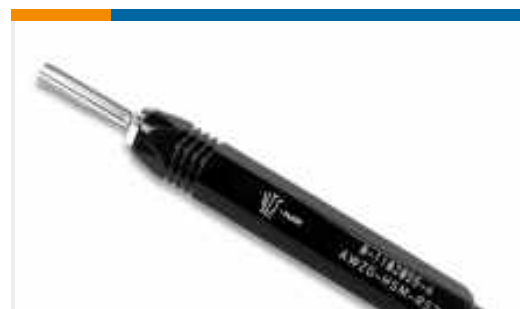
TE Teilenummer 1102855-4 AWZG-HSM-RSZ