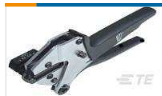
TE Teilenummer 2-1105870-8 RSZ.LC.4-10QMM