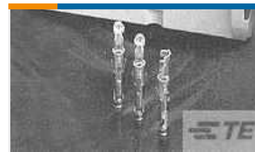
TE Teilenummer 2-1108756-1 HSK.Bu.C.2,5 qmm