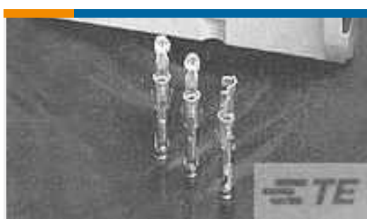
TE Teilenummer 5-1108756-1 HSK.Bu.C.10,0 qmm