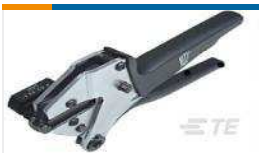
TE Teilenummer 1-1105870-8 RSZ.LC.0,75-2,5QMM