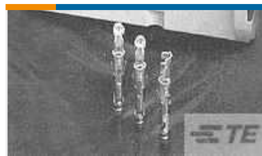
TE Teilenummer 3-1108756-1 HSK.Bu.C.4,0 qmm