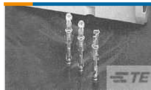
TE Teilenummer 4-1108756-1 HSK.Bu.C.6,0 qmm