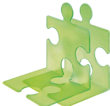
Buchstütze / CD-Ständer PUZZLE, 2er Set, grün-transluzent