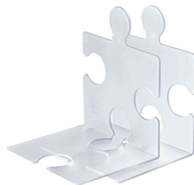
Buchstütze / CD-Ständer PUZZLE, 2er Set, klar-transluzent