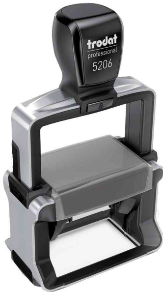
Textstempel Professional 4.0 5206

Zubehör: Ersatzstempelkissen: Abgabe nur in ganzen VE's