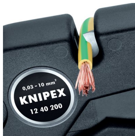
12 40 200: regulowany ogranicznik długości zdejmowanej izolacji