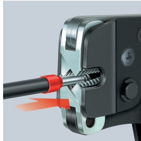
97 53 08: Einführen von Aderendhülsen parallel von der Seite bis 2,5 mm 2 z. B. unter beengten Platzverhältnissen Frontales Einführen von Aderendhülsen z. B. in Schaltschränken