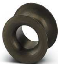
Hülsenpasseinsatz, Nennstrom: 4 A, Farbe: braun

https://www.phoenixcontact.com/de/produkte/0913223