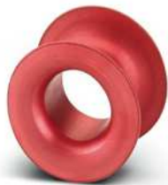
Hülsenpasseinsatz, Nennstrom: 2 A, Farbe: rosa

https://www.phoenixcontact.com/de/produkte/0913210