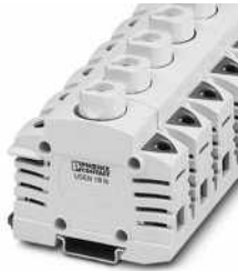
Sicherungsklemmen für NEOZED-Sicherungseinsätze

Bitte beachten Sie, dass die in diesem PDF-Dokument angezeigten Daten aus unserem Online-Katalog generiert wurden. Bitte finden Sie die vollständigen Daten in der Benutzer-Dokumentation. Es gelten unsere Allgemeinen Nutzungsbedingungen für Downloads.