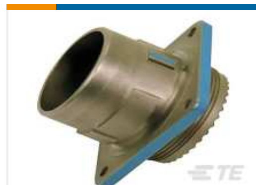
TE Teilnr.:YDIV44E11-35PAC009 RECP ASSY