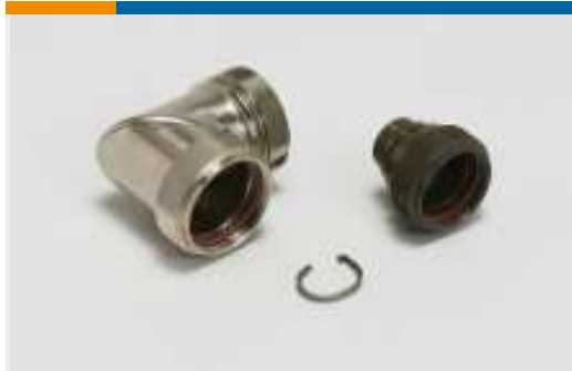
Abgeschirmte Endgehäuse und Adapter(1)