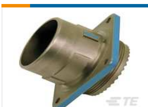
TE Teilnr.:YDIV46E13-98SAC009 PLUG ASSY