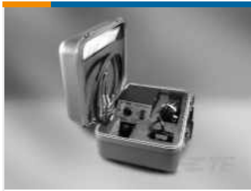
TE Teilnr.: 173643-000 RH-3960-1-TINEL-KIT-120V