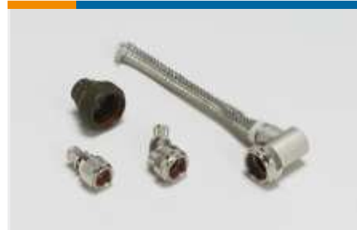
Robuste Endgehäuse und Adapter (2064)