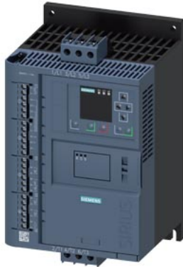
SIRIUS Sanftstarter 200-600 V 13 A, AC/DC 24 V Schraubklemmen