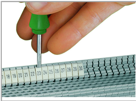
Einrasten eines WMB-Beschriftungsstreifens in die Beschriftungsaufnahme des Doppelschildträgers