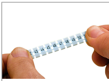
Strecken eines WMB-Beschriftungsstreifens