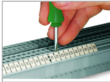
Einrasten eines WMB-Beschriftungsstreifens in die Beschriftungsaufnahme