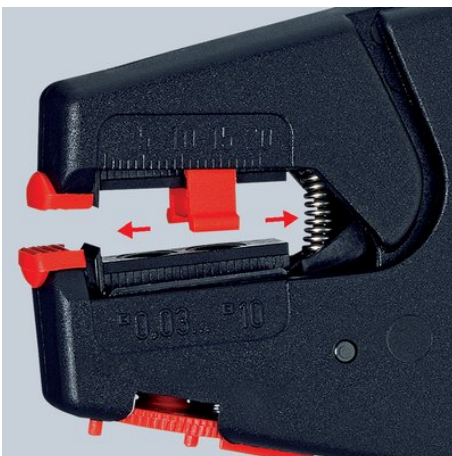
12 40 200: Einstellbarer Längenanschlag

Technische Änderungen und Irrtümer vorbehalten