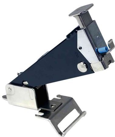
Agrafeuse électrique Classic 106E

- pour l'agrafage de brochures et des anneaux de serrage, ainsi que pour l'agrafage normal