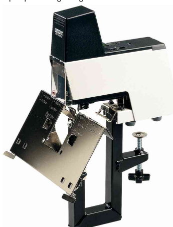
Agrafeuse électrique Classic 106E fixée au bureau