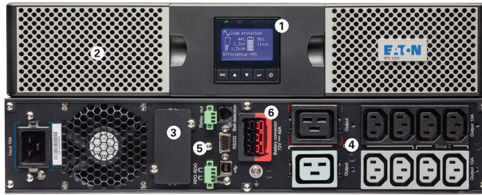
9PX von Eaton mit 3000 VA