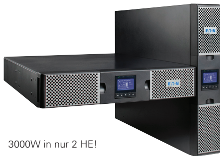
3000W in nur 2 HE!