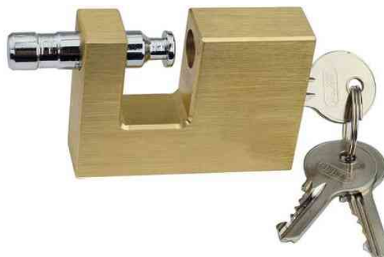
Cadenas à manille, ouvert