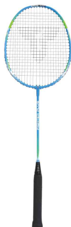
Raquette de badminton Fighter Plus