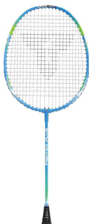
Raquette de badminton Fighter Plus, vue détaillée