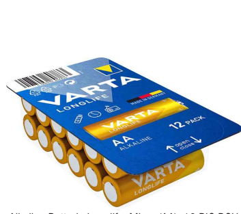
Alkaline Batterie Longlife, Micro (AA), 12er BIG BOX