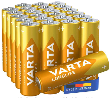
Alkaline Batterie Longlife, Micro (AA)

- ideal für Geräte mit konstantem und niedrigem Energiebedarf wie Spielzeug, Fernbedienungen, Wanduhren oder Radios