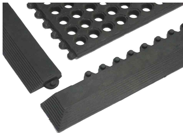
Vue détaillée - bordures