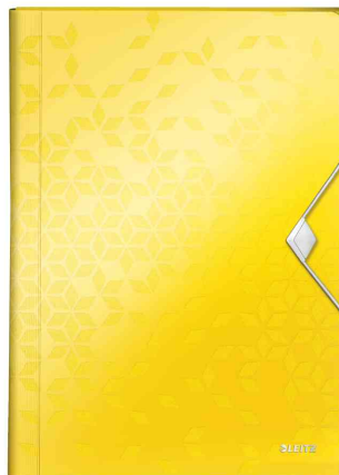
Trieur ménager WOW, jaune