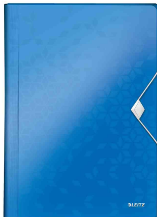
Trieur ménager WOW, bleu