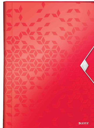
Trieur ménager WOW, rouge