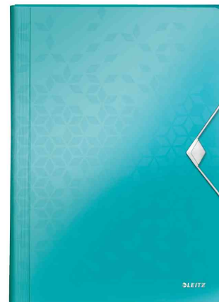
Trieur ménager WOW, menthe