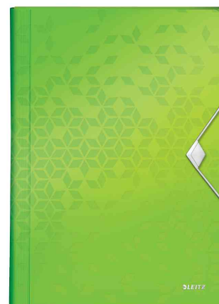
Trieur ménager WOW, vert