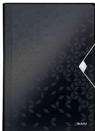
Trieur ménager WOW, noir