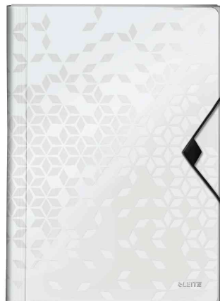
Trieur ménager WOW, blanc