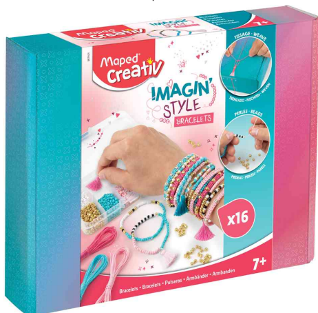
Kit bijoux IMAGIN'STYLE bracelets

ATTENTION ! ne convient pas aux enfants de moins de 36 mois, en raison de petites pièces pouvant être avalées.