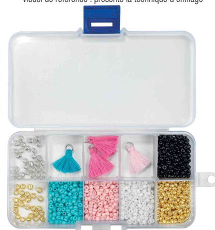
Visuel de référence : présente la boîte de rangement