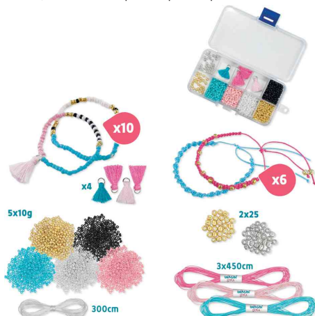
Kit bijoux IMAGIN'STYLE bracelets, contenu