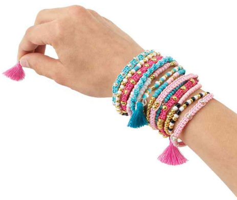
Visuel de référence : présente le résultat final