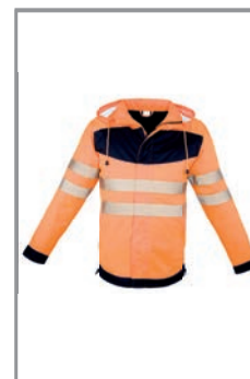
EOSPORBK Orange - Schwarz (Vorne) S - 5XL