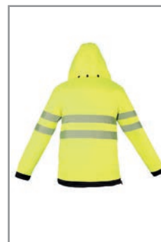
EOSPYWBK Gelb - Schwarz (Hinten) S - 5XL