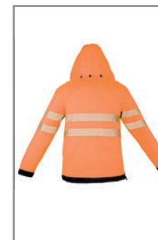
EOSPORBK Orange - Schwarz (Hinten) S - 5XL