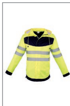
EOSPYWBK Gelb - Schwarz (Vorne) S - 5XL

Industrie, Verkehr und Logistik, Veranstaltungen, Bauwesen, Behörden, Flughäfen, Sicherheit