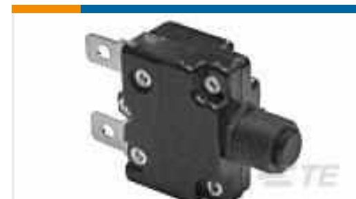
TE Teilnr.:1-1423675-0 W57-XB7A4A10-20=CKTBKR,THERM,P