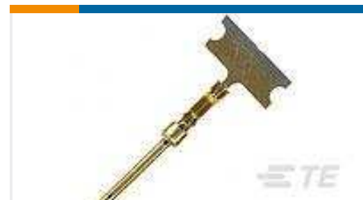
TE Teilnr.:166293-1 LP HD20 COSI PIN CONTACT DF; 24-20 AWG