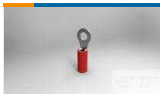
TE Teilnr.:36150 PIDG R 22-16 COMM 22-18 MIL 6