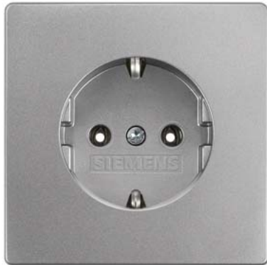
DELTA style platinmetallic SCHUKO ohne Krallen 68x68mm 10/16A 250V