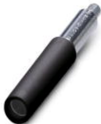
Zdířka zkušební zástrčky, barva: černá

Upozorňujeme, že zde uvedené údaje pocházejí z online katalogu. Úplné informace a údaje naleznete v uživatelské dokumentaci. Platí všeobecné podmínky použití pro stahování z internetu. ( http://phoenixcontact.de/download )