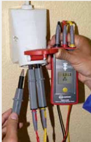
Überprüfung von Steckdosenverkabelung