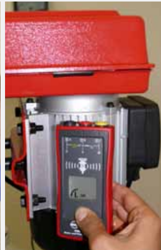
Kabellose Prüfung der Motor-Drehrichtung