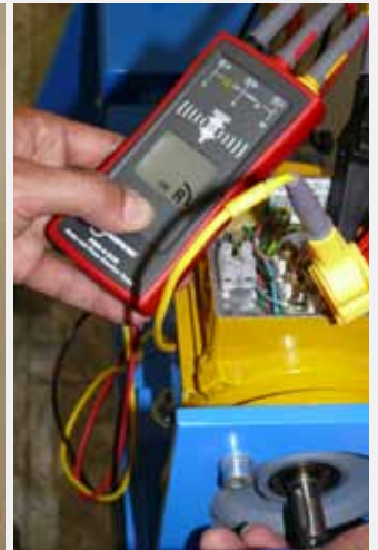
Prüfung der Motor-Drehrichtung vor dem Anschließen