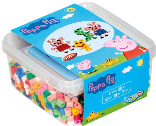
Bügelperlen maxi + Stiftplatte "Peppa Wutz", in Box

ACHTUNG! Nicht geeignet für Kinder unter 36 Monaten, wegen verschluckbarer Kleinteile.